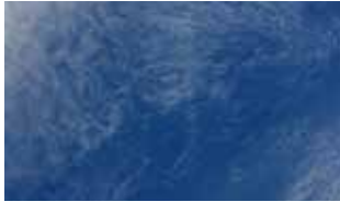
Hören Sie mal ...