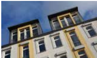
Wohnhaus Schneiderberg 17